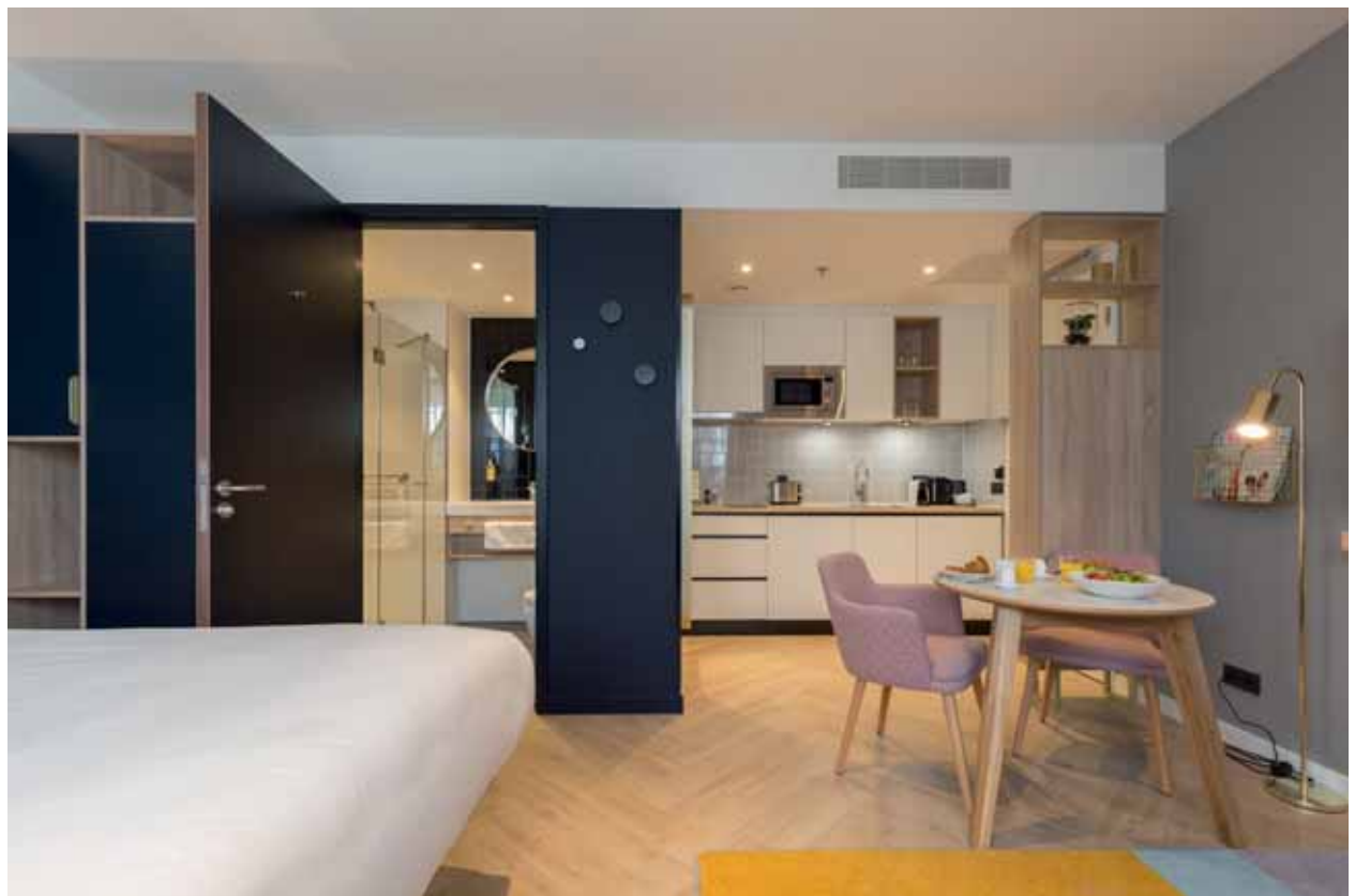
FOTO ONDER Een suite waarin de zit-, slaap-, bad- en keukenruimte zijn geïntegreerd tot een huiselijk, comfortabel ensemble.

FOTO RECHTSBOVEN De wasserette, waar de gasten hun was kunnen doen, is ondergebracht in de vroegere kluis van het gebouw.